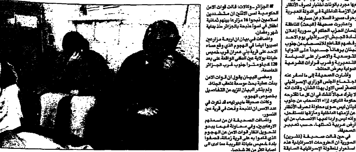
جزائريون يتناولون من أكل مذبحة شهدتها قرية قريبة من خمسين كيلومترا غرب العاصمة الجزائرية